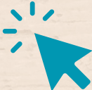
Ordering Food Vocabulary Unit