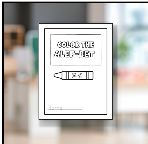
Alef-Bet Coloring Booklet