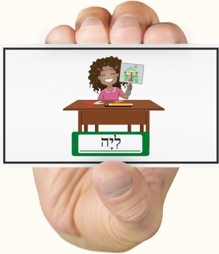
GUESS THE CHARACTER in Hebrew